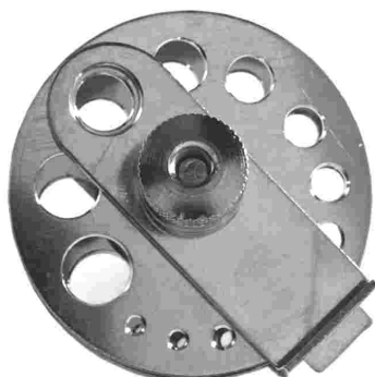
Perlenhalter | rund | 13 Löcher

für Kugeln ca. 2 - 7 mm | Artikel-Nr. 08 03 003