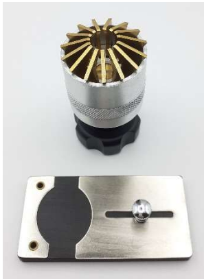
Uhrglasabheber Vigor S

Bestimmte Stoffe, Gemische und Erzeugnisse werden als Gefahrstoffe eingestuft (§2 Abs. 1 GefStoffV) und unterliegen besonderen Sorgfaltspflichten bei der Abgabe und dem Transport. Sie finden entsprechende Hinweise auf unserer Website, außerdem beraten wir Sie gerne persönlich.