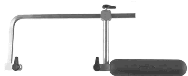
Laubsägebogen | 1a | CH - Qualität

verstellbar | 200 mm tief | Artikel-Nr. 04 01 020