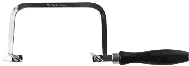
Laubsägebogen | Holzgriff

fest | 80 mm tief | Artikel-Nr. 04 01 001