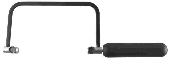
Laubsägebogen | 1a | CH - Qualität

fest | 80 mm tief | Artikel-Nr. 04 01 001